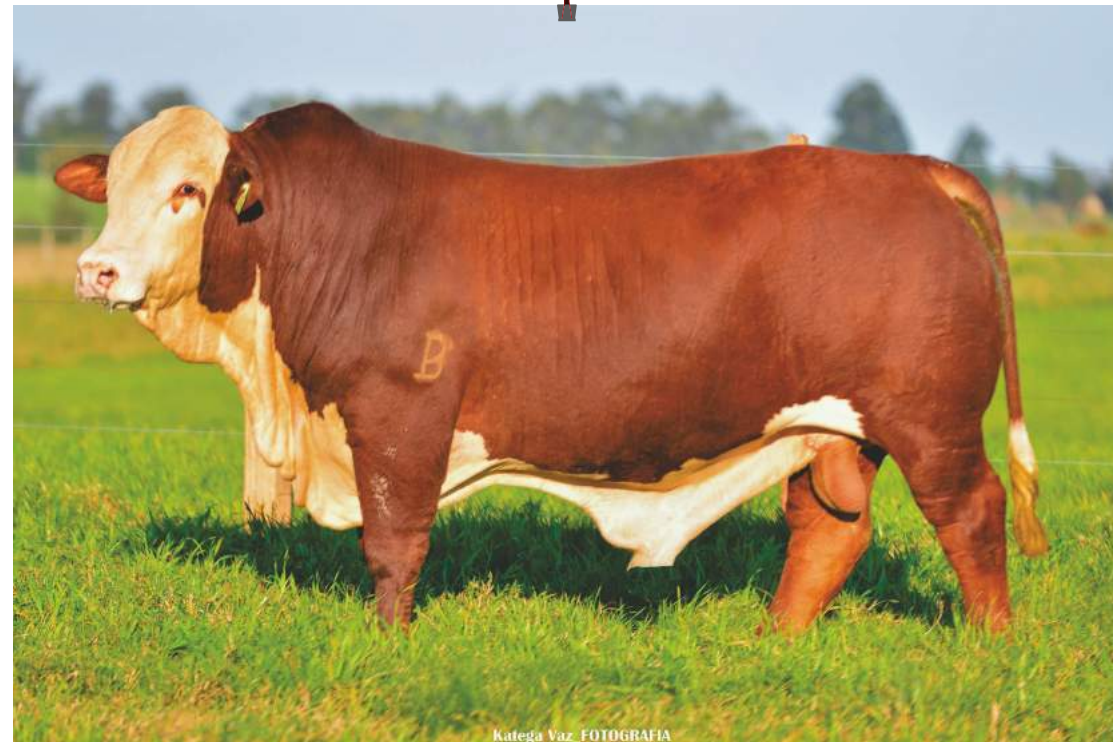
Katega Vaz FOTOGRAFIA